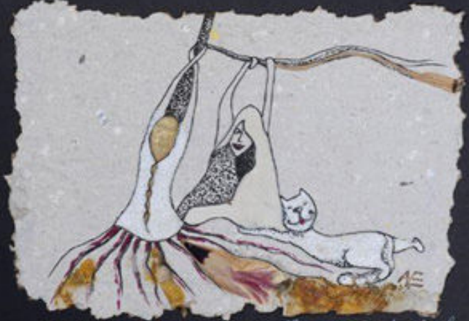
Pis. - kuisa tasakal