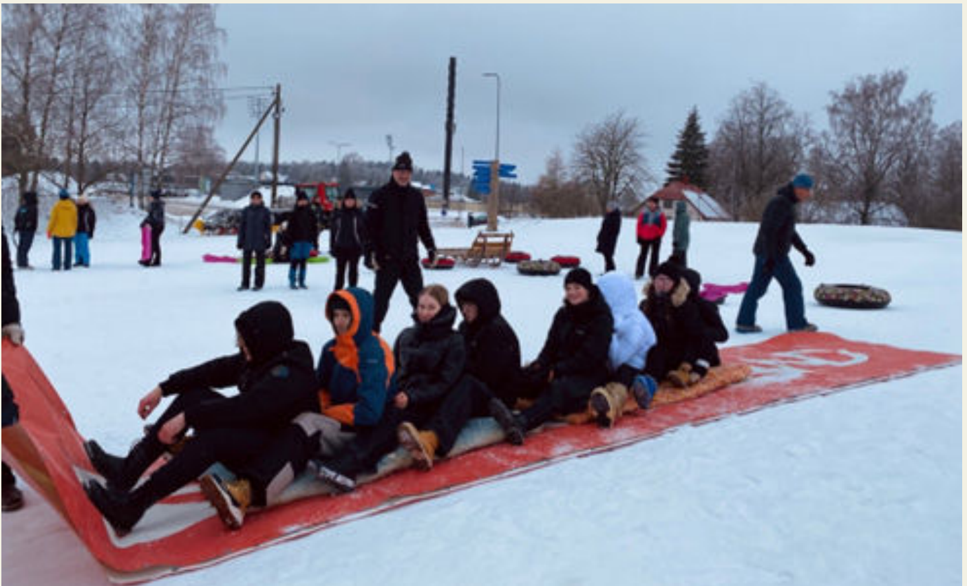
Pildil OG 12. klassi liikumiskursuse õpilased.

Eriti vahvat liugu said nautida 12. klassi liikumiskursuse õpilased, kelle tund sattus olema samal ajal, kui Tehvandi kollektiiv oma vastlapäeva tähistas. Neljakasemäele oli toodud tuubid, vanaaegne puust regi, suur kalamehekelk ja Sportlandi reklaamplakat. Abituriendid said kogu kursuse õpilastega liugu lasta nii tuubidega kui ka suurel reklaamplakatil istudes.